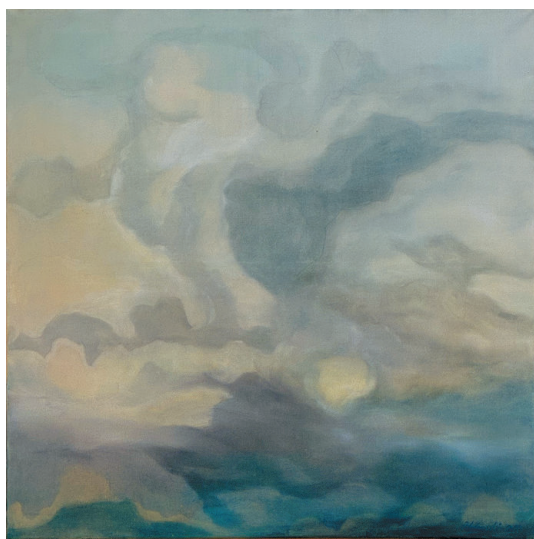
Turbolenze, 2022 olio su tela cm 90 x 90