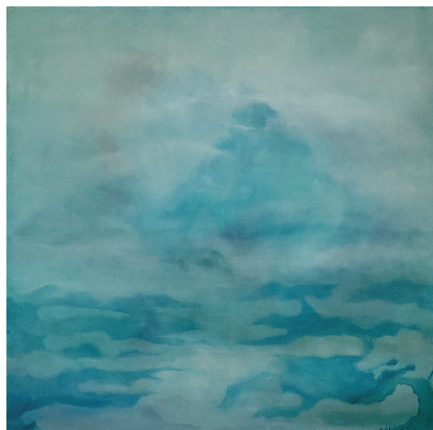
Paesaggio, 2021-2022 olio su tela cm 100 x 100