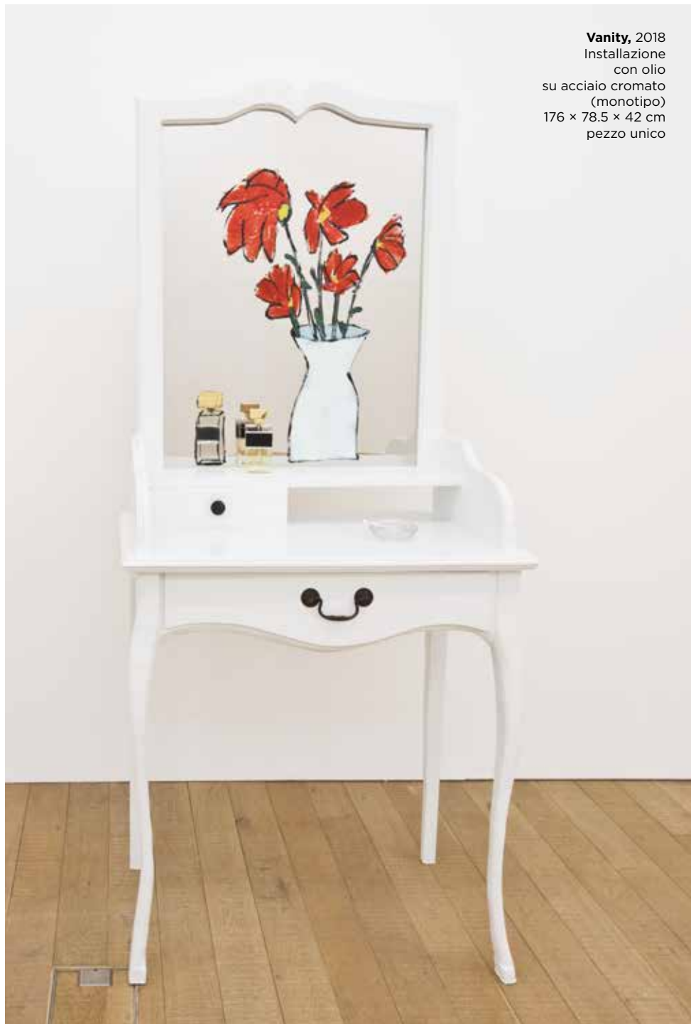
Vanity , 2018 Installazione con olio su acciaio cromato (monotipo) 176 × 78,5 × 42 cm pezzo unico