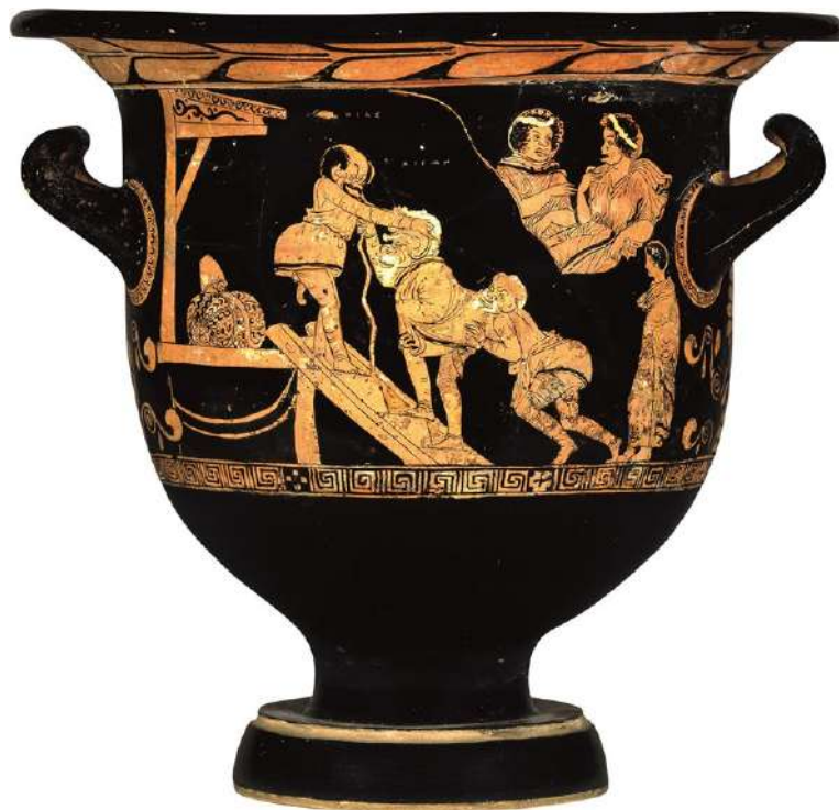
Pittore di McDaniel, Parodia della cura medica, il dio Apollo cura il centauro Chirone , cratere a campana a figure rosse, ca. 380-370 a.C., provenienza apula, Londra, British Museum.