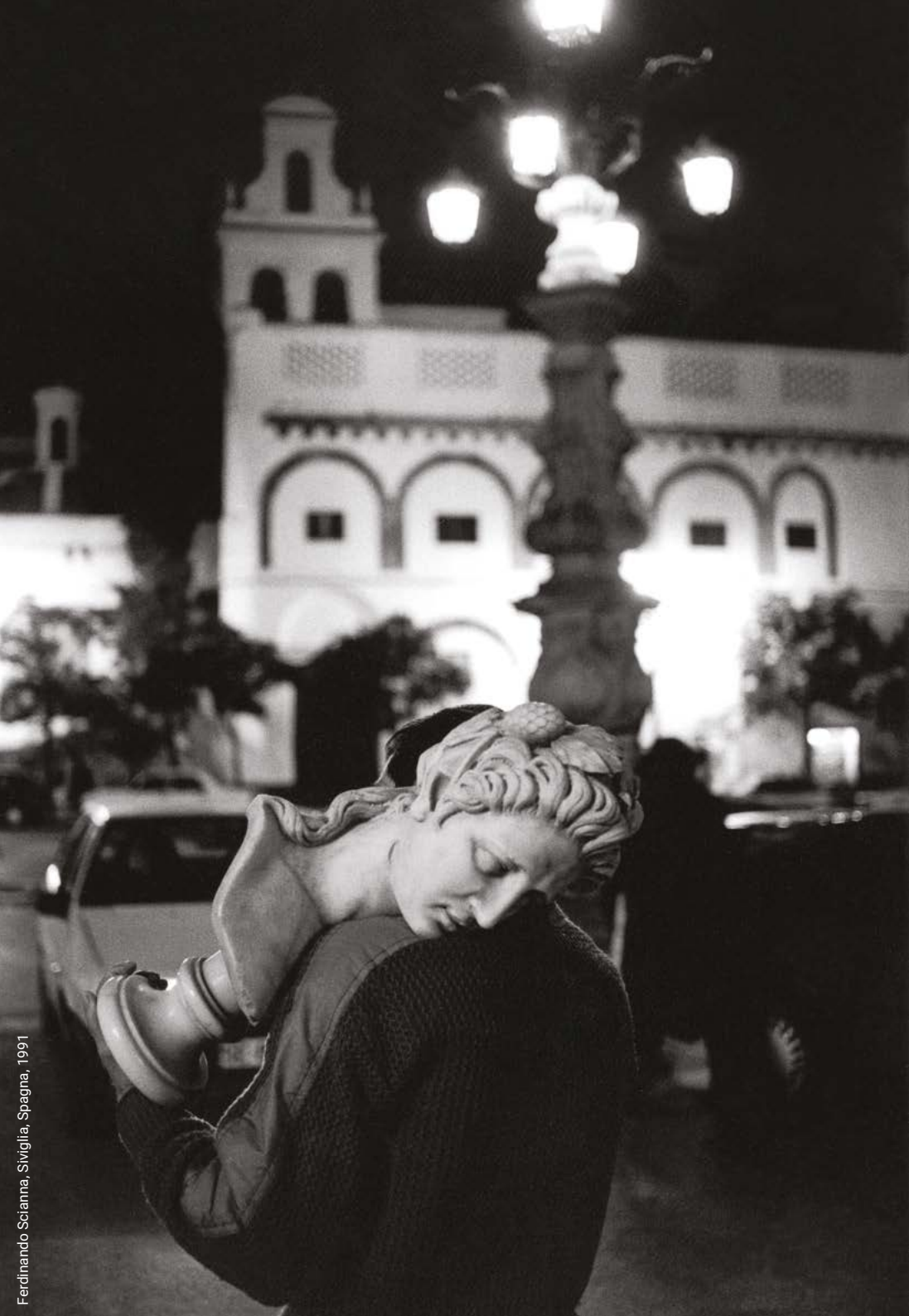
Ferdinando Scianna, Siviglia, Spagna, 1991