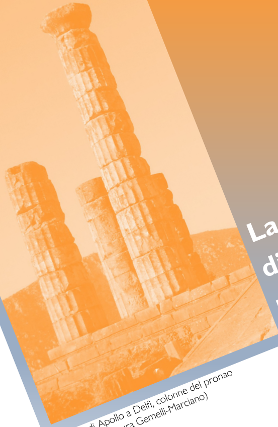
Tempio di Apollo a Delfi, colonne del pronao (fotografia di Laura Gemelli-Marciano)

Incontro Presentazione Conferenza Vernice mostra Spettacolo Concerto Premiazione Giornata cantonale